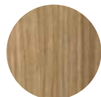
Impallaciato Rovere 10.82