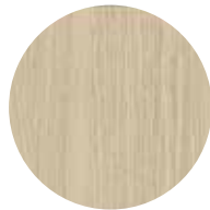
Rovere Margò Oak Margò