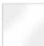
U11209 HG lucido + film