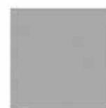
Grigio metallizzato F70015