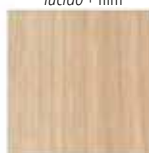
Rovere rigato R20095