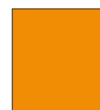
Arancio RAL 2003