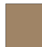
Tortora RAL 1019