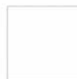
Bianco span W10140