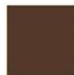
Testa di moro U16182