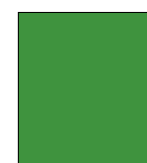
Verde RAL 6018

COLORI SU RICHIESTA - ON DEMAND FINISHES CONSEGNA 45 GIORNI - DELIVERY IN 45 DAYS