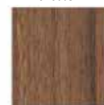
Noce Palermo R30108