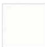
Bianco supremo U11209

COLORI SU RICHIESTA - ON DEMAND FINISHES CONSEGNA 30 GIORNI - DELIVERY IN 30 DAYS