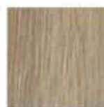
Rovere scuro R20064