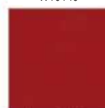
Rosso rubino U17008