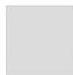
Grigio chiaro U12188