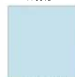
Blu Cristallo U18003