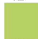
Verde limone U630